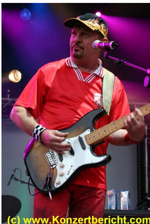
Spider Murphy Gang live on stage