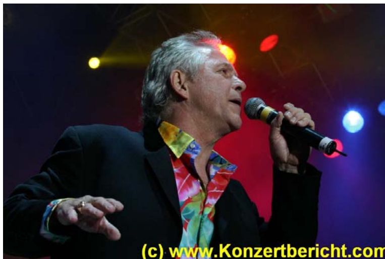
Dave Dee live on stage

Dave Dee und seine Soloauftritte, gehören zu denen die wir im letzten Jahr wirklich oft gesehen und gehört haben. Als mehr oder weniger einzige Band des Abends, die wirklich Ihre Wurzeln in den sechziger Jahren haben, fällt hier wirklich der Genre Wechsel zur vorherigen Band auf. Letztendlich ist es aber genau das, was den Reiz dieser Festivals ausmacht. Diesen absoluten Facettenreichtum über Generationen von Bands, sei es aus den sechziger, siebziger oder achtziger Jahren, findet man bei der vermeintlich modernen Musik nicht. Daher machen Titel wie „ Band it “, „ Hold tight “ oder „ Zabadak “ einfach immer noch Spaß. Auch die obligatorische Peitsche bei „ The legend of xanadu “ darf nicht fehlen.