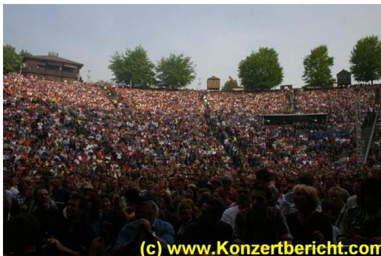
11.000 Musikbegeisterte Fans in der Kalkbergarena