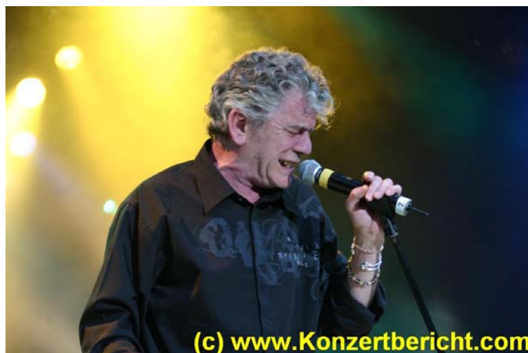
Dan McCafferty von Nazareth live on stage