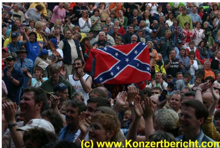
die Segeberger Oldie-Fans