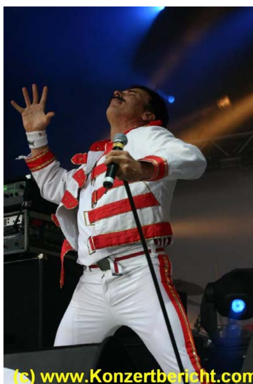
MerQuery live on stage