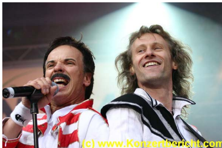
MerQuery live on stage