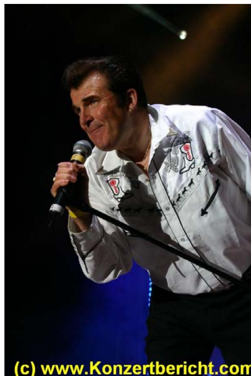
Matchbox live on stage