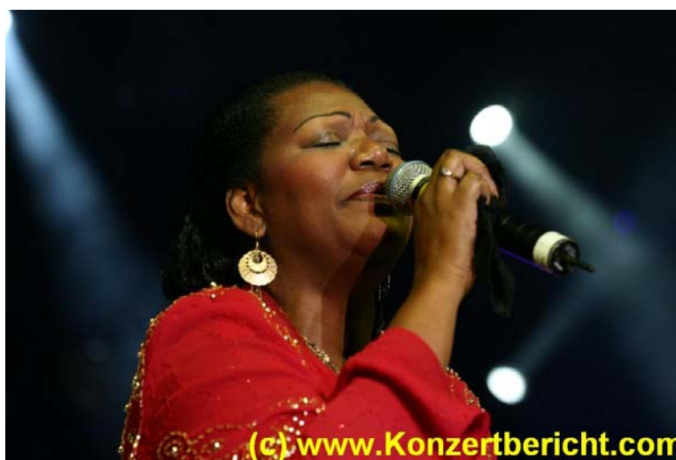
Liz Mitchell live on stage