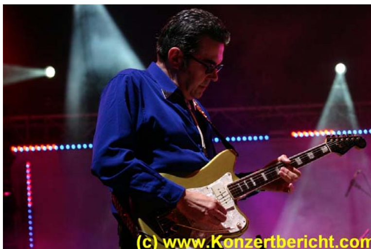
Matchbox live on stage

Neuland für uns war die Rockabilly Gruppe Matchbox , die seit 1977 in Originalbesetzung auftreten. Entdeckt wurden sie während der Carl Percins Europatournee. Magnet Records nahm die fünf sogleich unter Vertrag und feierte einige beachtliche Erfolge. Da wären der Nummer Eins Hit „ Rockabilly Rebel “ und natürlich „ When you ask about love “ zu nennen. Wir hörten neben „ Baby Doll “ auch „ lonesome me “. Nicht so ganz unsere Richtung, aber wir müssen ja auch nicht bei jeder Musikrichtung aus dem Häuschen sein. Viel wichtiger ist, das es der Masse des Publikums sehr gut gefallen hat.