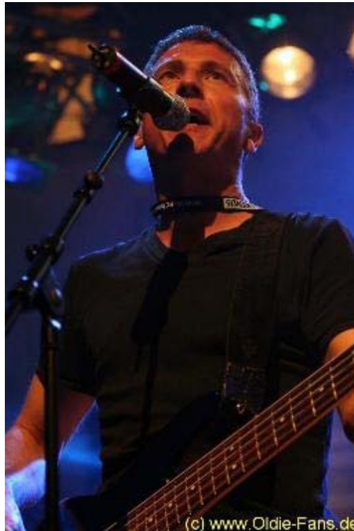
CCR-Revival Band live on stage

Anschliessend war Zeit für uns ein wenig zu verschlafen und das Rahmenprogramm ein wenig genauer unter die Lupe zu nehmen. Hier wurde tatsächlich einiges geboten. Etliche Futter- und Getränkebudnen luden zum verweilen ein, die Polizei war eigens mit einen Informationsstand vor Ort und man konnte auch sportlich auf dem Fahrrad zeigen, wie fit man ist. Man muss sich wirklich immer wieder vor Augen halten, das sämtliche Künstler, Techniker, Verkäufer und Helfer völlig ehrenamtlich mitwirken! Alle Getränke und Lebensmittel werden ebenfalls gespendet, so das tatsächlich alle Einnahmen den krebskranken Kindern zu Gute kommen.