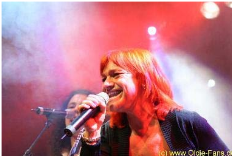
Lou live on stage

Noch während des Meet & Greets war LOU auf der Bühne. LOU sollte spätestens ein Begriff sein, nachdem Sie am deutschen Vorentscheid zum Grand Prix mit dem Titel " let's get happy " gewonnen hatte. Exakt dieser Titel, der beim Grand Prix in Riga einen respektablen 12. Platz erreichte, war auch der Opener für Ihren Auftritt in Appen. Es folgten Titel wie " Ich will leben " und " Alles was ich liebe ". Zum letzten Titel kam ich noch hinzu um schnell ein paar Fotos schießen zu können.