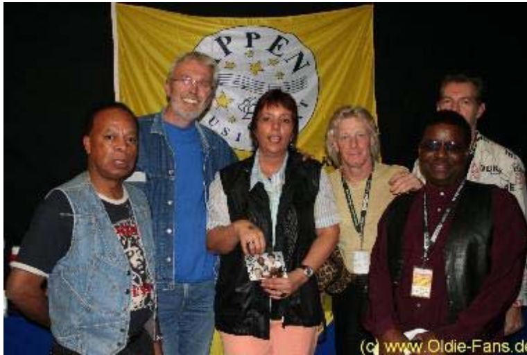
Das Meet & Greet mit den Equals

Noch während des Meet & Greets war LOU auf der Bühne. LOU sollte spätestens ein Begriff sein, nachdem Sie am deutschen Vorentscheid zum Grand Prix mit dem Titel " let's get happy " gewonnen hatte. Exakt dieser Titel, der beim Grand Prix in Riga einen respektablen 12. Platz erreichte, war auch der Opener für Ihren Auftritt in Appen. Es folgten Titel wie " Ich will leben " und " Alles was ich liebe ". Zum letzten Titel kam ich noch hinzu um schnell ein paar Fotos schießen zu können.