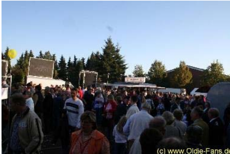
Buntes Treiben rund um die Veranstaltungshalle

draussen stand eine riesige Leinwand bereit, die das Geschehen live übertrug.