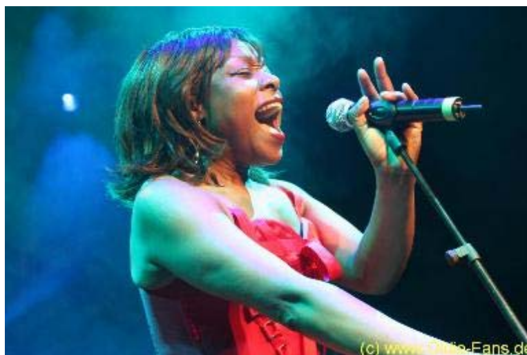
Precious Wilson (Eruption) live on stage