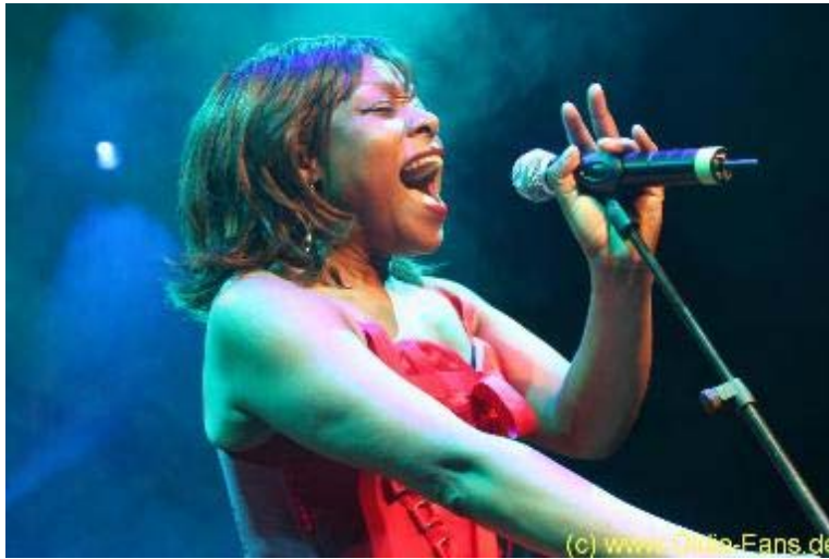
Precious Wilson live on stage