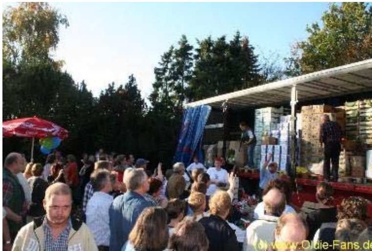
"Marktschreier" sorgen für reichlich Stimmung

Anschliessend war Zeit für uns ein wenig zu verschlafen und das Rahmenprogramm ein wenig genauer unter die Lupe zu nehmen. Hier wurde tatsächlich einiges geboten. Etliche Futter- und Getränkebudnen luden zum verweilen ein, die Polizei war eigens mit einen Informationsstand vor Ort und man konnte auch sportlich auf dem Fahrrad zeigen, wie fit man ist. Man muss sich wirklich immer wieder vor Augen halten, das sämtliche Künstler, Techniker, Verkäufer und Helfer völlig ehrenamtlich mitwirken! Alle Getränke und Lebensmittel werden ebenfalls gespendet, so das tatsächlich alle Einnahmen den krebskranken Kindern zu Gute kommen.