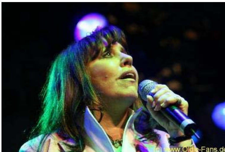
Tina York live on stage

Nun wurde es aber wirklich Zeit für den ersten musikalischen Auftritt. Tina York , die gerade erst Ihr neues Album " Du bist Champagner für die Augen " veröffentlichte, verwöhnte die Zuhörer mit Ihren Evergreen „ Wir lassen uns das Singen nicht verbieten “ - einer der großen Hit's der 70er Jahre. Über 100 Songs hat Tina schon aufgenommen und bisher 43 Singles sowie 9 Longplays und Best-of-Alben veröffentlicht. In der ZDF Hitparade hat sie sich 30 mal (!!!) platziert, welches nur ein Meilenstein neben vielen weiteren Ihrer bisher langjährigen Karriere bedeutete. Ihr Superhit "" Immer wieder Sonntags "" wurde ebenso begeistert aufgenommen wie auch der etwas neuere Titel „ Ich darf das!!! “. Hat uns gut gefallen!