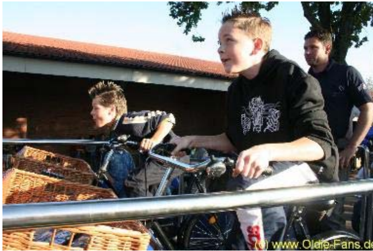
Auch sportlich wurde einiges geboten