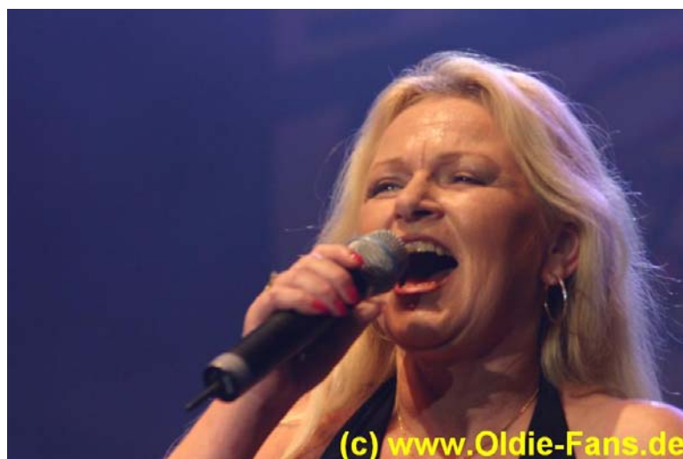
Tony Wille (Pussycat)

Den Anfang des abends mache Tony Wille , die ehemalige Frontfrau von " Pussycat ". Mit ihrem lieben freundlichen Wesen sang sie sich mit den größten Erfolgen wie "Georgie", "Smile" und natürlich "Mississippi" in die Herzen des Publikums. Da meine Mama ja ganz großer Fan des Liedes "Mississippi" ist, wollten wir ihr eigentlich als Überraschung nen Autogramm mitbringen. Doch leider hat Tony wohl unsere Bitte vergessen und war schups-di-wups nach dem gang in die Umkleidekabine nicht mehr gesehen worden. wirklich sehr schade!!!