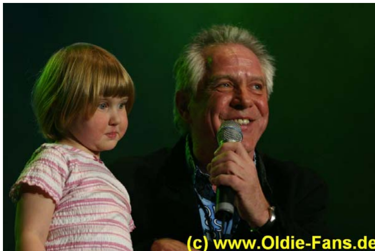
Dave Dee mit seinem jüngsten Fan

Dozy, Beaky, Mick und Tich zu Hause gelassen und heizte dem Publikum alleine ein. Wer ihn schon mal live gesehen hat weiß, dass er bei dem Lied "Legend of Xanadu" immer eine Peitsche dabei hat. Diesmal musste er leider ohne dieses Markenzeichen auftreten, denn die Sicherheitskontrolle am Flughafen in London hatten ihm das gute Stück abgenommen ;-) Aber er brachte auch ohne diesen Utensil seinen Auftritt mit gewohnter Professionalität zu Ende. Hinter der Bühne hörten übrigens Steve und Martin von Smokie, dass er ein Medley sang, in dem auch der Song "Needles and Pins" vorkam. Fanden die beiden eigentlich gar nicht so lustig, denn den Song wollten sie den Abend auch noch spielen, trotzdem wurde dann herzlich nur drüber gelacht.