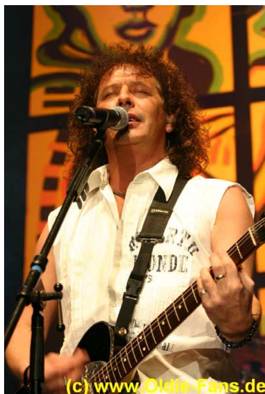
(c) www.Oldie-Fans.de Mike Craft (Smokie)