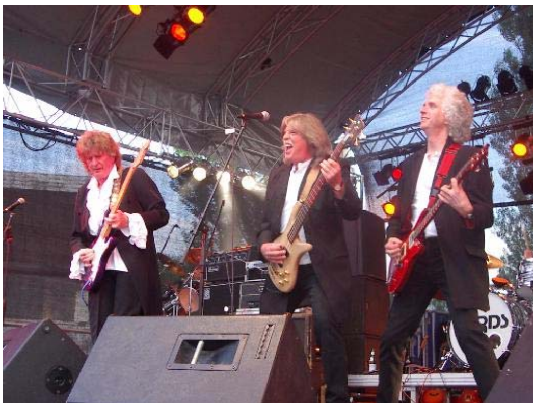
The Lords live on stage