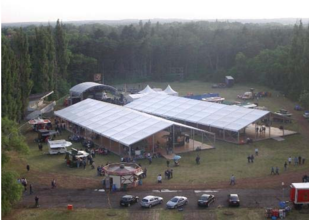
Das Open-Air-Gelände in Wünsdorf

So gegen 17.00 Uhr machten wir uns dann mithilfe unserer "Hilde" auf den Weg nach Wünsdorf zum Open-Air-Gelände. Das war auch gar nicht schwer zu finden, da es sehr gut ausgeschildert war. Wir durften dann auch gleich mit unserem Auto auf das Gelände fahren (Danke noch mal an den netten Ordner, der uns durch ließ, obwohl wir unsere Presse-Pässe noch nicht bekommen hatten) und unser Auto direkt hinter der Bühne parken. Wir hatten das Gelände der ehemaligen Heeres-Sportschule ja schon mal "nackt" auf Fotos gesehen, aber was für die Veranstaltungen an diesem Wochenende daraus gemacht wurde war echt grandios. Zwei riesige Zelte boten den Besuchern Schutz vor Regen (den wir gestern aber zum Glück nicht hatten) aber trotzdem freie Sicht zur Bühne. Weiter hinten in den Zelten und auch von vorne konnte man das ganze Geschehen auf der Bühne dann auch noch auf vier großen Leinwänden bestaunen, die an der Zeltdecke angebracht waren. Einfach gut durchdacht die ganze Sache.