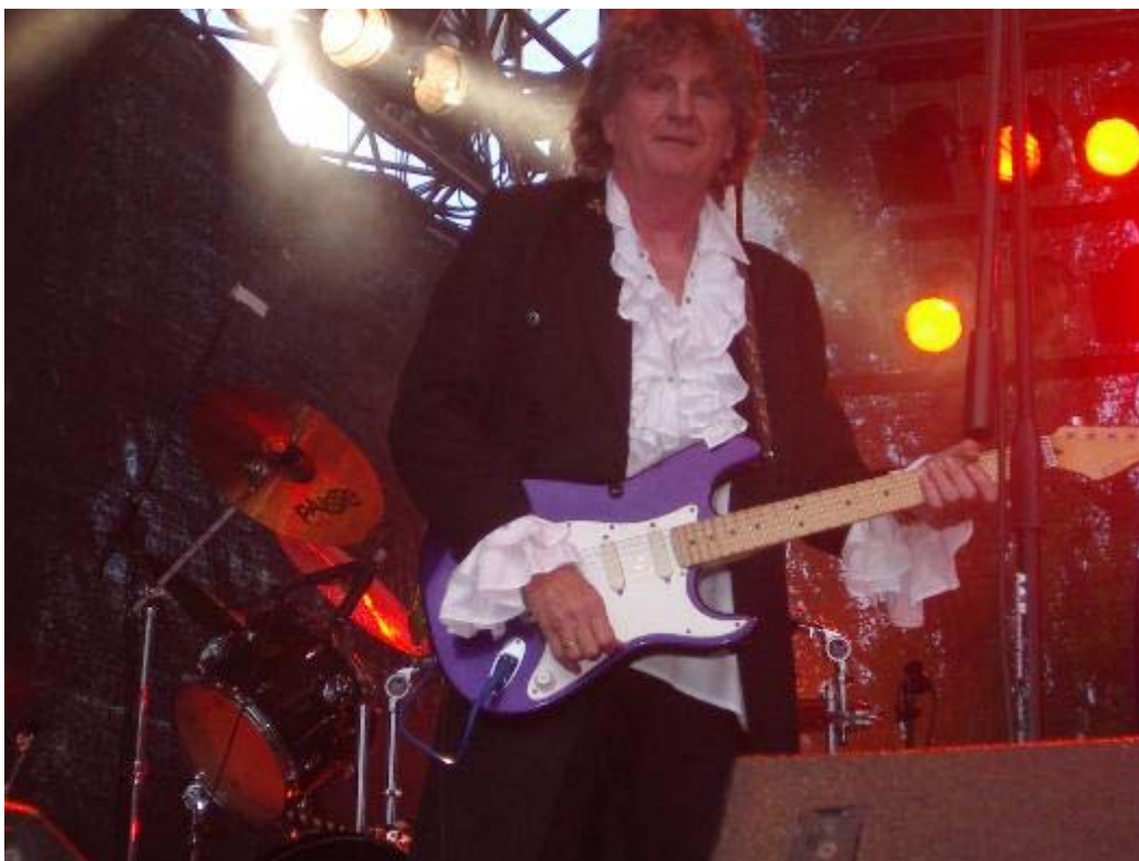
Leo live on stage

Nachdem die Lords ihren Fans 90 Minuten lang so richtig eingeheizt hatten, hatte das Publikum erst mal eine kleine Verschnaufpause, denn die Bühne musste nun für Smokie umgebaut werden. Zeit genug, um mal hinter der Bühne zu verschwinden.