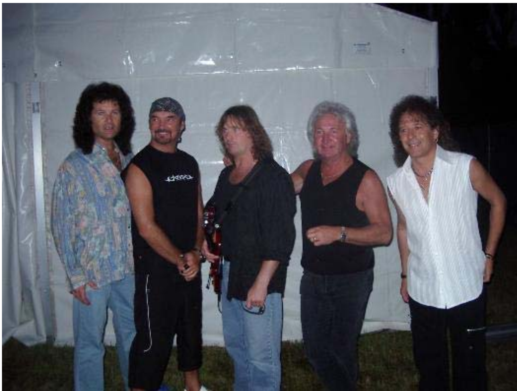
Smokie vor ihrem Auftritt

Wie gewohnt ging es erst einmal mit einem Band-Intro von "it never rains in southern california" los und die Fans drehten prompt komplett durch, als die Band mit Elan auf die Bühne kam um das Intro durch Livemusik abzulösen. Oft haben wir es schon über Smokie geschrieben und versucht zu erklären, wie die Jungs innerhalb von Sekunden eine derartige Wohlfühl-Atmosphäre zaubern können. Schwer zu beschreiben, ehrlich. Ihr müsst es einfach mal live erleben. Smokie bringt besonders Live einfach nur Spaß - probiert es unbedingt aus! Das das Publikum gut mitgeht, hat man spätestens beim Song "Oh Carol" gemerkt. Bei der Zeile "Oh I am floatin' on the milky way" wurden haufenweise ebensolche Milky Ways auf die geworfen, die Terry auch versuchte zu futtern, während er weiter an seinen Bass zupfte. :-) Nach einer langen Zugabe war dann nach über neunzig Minuten Schluss für heut', aber pures Rock n'Roll sollte ja noch folgen.